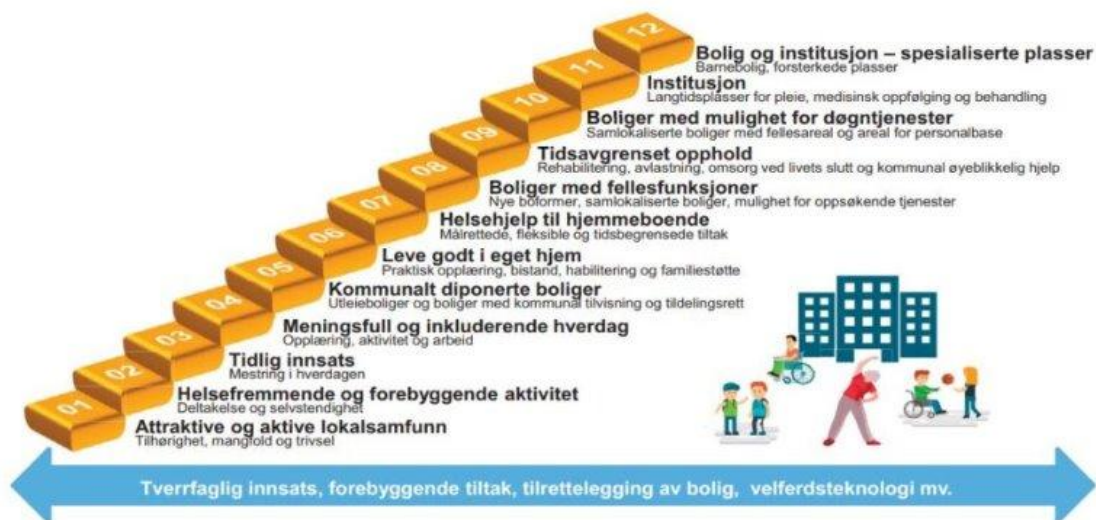
Figur 2: Helhetlig innsatstrapp etter Agenda Kaupang

Innsatstrappen er en tverrsektoriell strategi for hvordan fremtidens helsetjenester skal se ut for alle, og viser graden av inngripen i befolkningens liv.