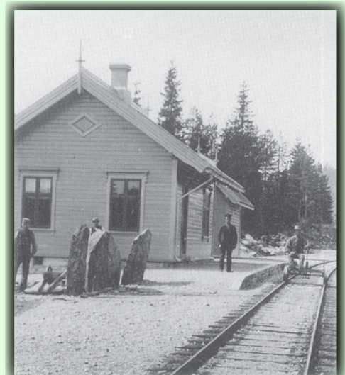
Slik så Tveide stasjon ut i gamle dager. Legg merke til Skilsteinene!

Die ländliche Siedlung um Tveide besteht aus vielen naturschönen Bauernhöfen, das lokale Museum ist ein von ihnen. Die Wanderung fängt an Birkeland Schule an, passiert See Valtjønn, kreuzt die Strasse und geht weiter gegen Vassbotn. Der Pfad geht weiter bis zum Grasham Museum mit seinen 9 historischen Gebäuden von den 18-19den Jahrhundert. Es geht bis zur Skillevegssletta und dem alten Tveide Bahnhof. Hier gibt es ein uraltes Steinmonument. Der Legende nach sollen vier Steine zum Gedächtnis eines besonderen Gesetzes aufgerichtet worden. Der Pfad folgt der Eisenbahn zurück zum Schulgebiet. Anfangspunkt: Parken wird empfohlen am Sportzentrum an den Schulen.