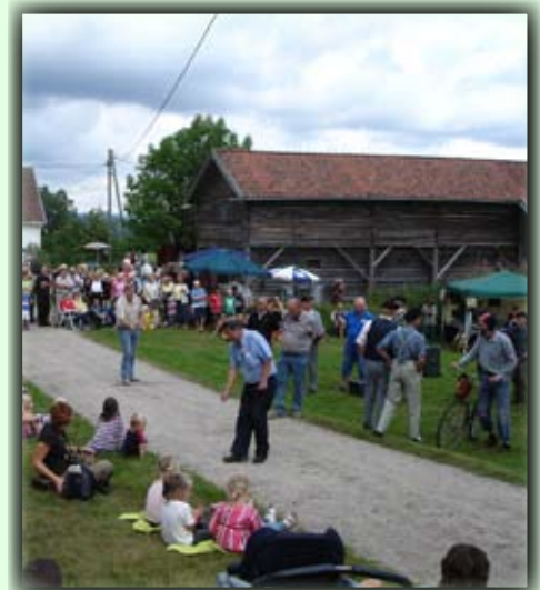
På den årlige Grashamdagen er det et yrende liv på museet.

Birkeland skole ligger ved Birkeneshallen, sørøst for Birkeland sentrum.