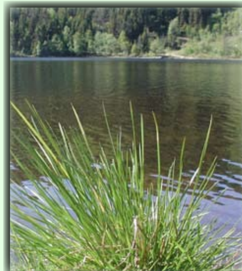
Det er mange idylliske steder langs Berse