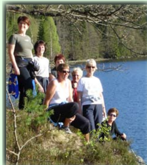
Kveldssola er god å ha!

Løypa starter foran Birkeland skole som ligger ved Birkeneshallen, sørøst for Birkeland sentrum. Man kan også starte fra Piggvoll eller fra Tøane boligfelt.