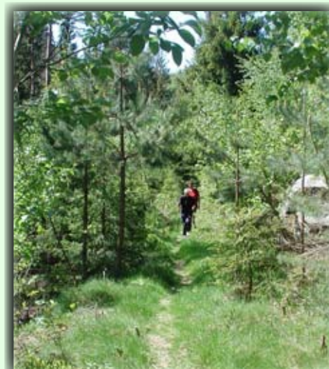
Stien går i lett skogsterreng

Røllend ist eine schöne Stelle, die östlich von Berse südlich von Birkeland Zentrum liegt. Anfangspunkt: Birkeland Schule, man wandert da wo die ehemalige Eisenbahn lag, biegt bei südliche Teil von Valtjønn ab, kreuzt Tveideveien und geht auf dem Pfad südlich von Tøane Baugelände. Hier geht ein Pfad im Wald gegen die See Berse. Man kann auch von Piggvoll oder Tøane Baugelände aufgehen.