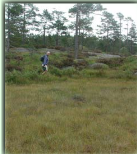
Kongevegen går gjennom et naturskjønt område