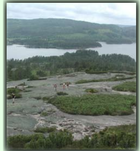
Utsikt over Haukomvannet