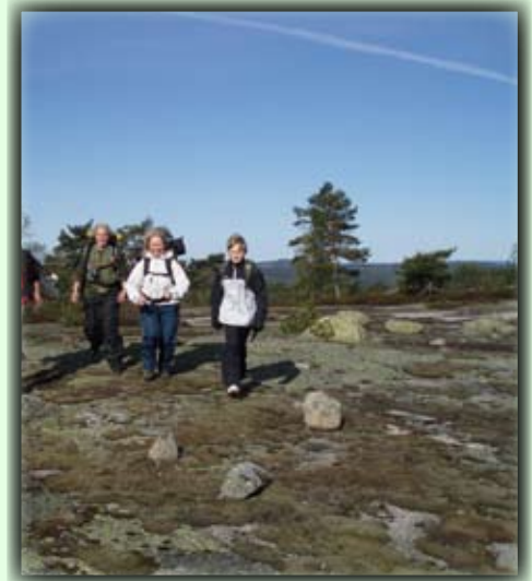
Det er et nydelig terreng å gå i på Toplandsheia

Fra Birkeland kjører man nordover mot Herefoss ca 17 km og tar til høyre ved skiltet merket skiløyper Toplandsheia. Veien følges helt opp til parkeingsplassen. Bomveg – kr. 30 for dagsparkeing.