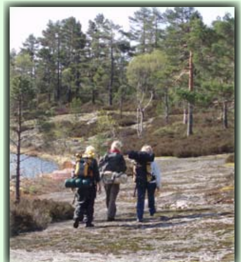
Glade vandrere på heia

Anfangspunkt: Man muss 17km nördlich von Birkeland fahren, dann am Schild zu „skiløyper Toplandsheia“ rechts abbiegen. Folge dem Weg zum Parkplatz. (Zollweg NOK 30,-)