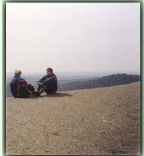
Unik utsikt fra toppen

16 km fra Birkeland står skilt inn til Lunden. Fra hovedveien kjører man ca 3 km til Heimdal (parkeringsplass).