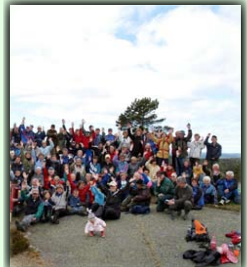
Fra åpningen av den nye turstien til Heimdalsknuten der ca 200 møtte opp!