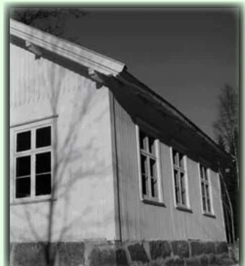
Det gamle skolehuset på Heimdal

Heimdalsknuten Hügel (429m. ü.m) ist einer der schönsten Aussichtspunkte in Landkreis Birkenes. Die Spitze ist riesig nut dicken und flachen Steinen. Man kann die ganze Küstenlinie von Kristiansand bis Arendal sehen. Die Route fängt vom Parkplatz an Heimdal an. Zuerst muss man der Strasse mit Splitterdecke folgen und weiter auf einem Pfad wandern. Wenn man zurückkommt, kann man wählen „See Knutetjønn“ zu passieren. Abstand 5km total. Auf Heimdal ist das alte Schulhaus wert zu sehen. Anfangspunkt: Man muss nördlich von Birkeland gegen Evje fahren. Nach 16km, muss man nach „Lunden“ links abbiegen. Die Strasse 3km folgen bis zum Parkplatz auf Heimdal.