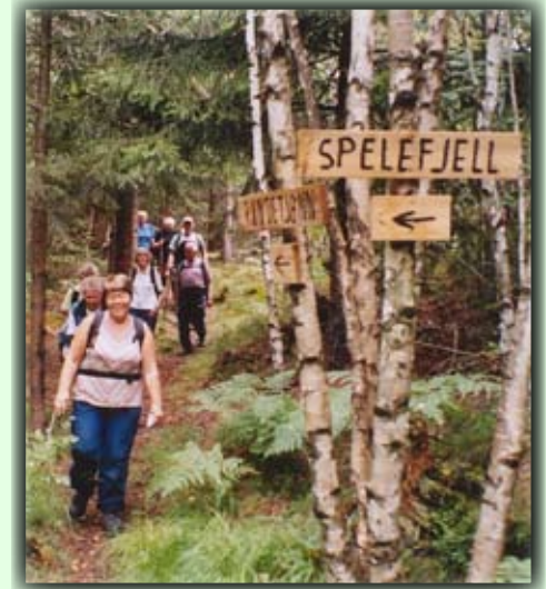
Seniorturgruppa på vei til Spele fjell

Fra Birkeland sentrum tar du Nordåsveien opp mot Grantun og Nordåsen. Man følger Nordåseveien helt til nr 52. Her er det parkeringsplass og skilt som viser turløypene i området. - Man kan også gå opp bakken bak Birkeland trykkeri (sentrum nord) og kommer inn på turstien på toppen av bakken.