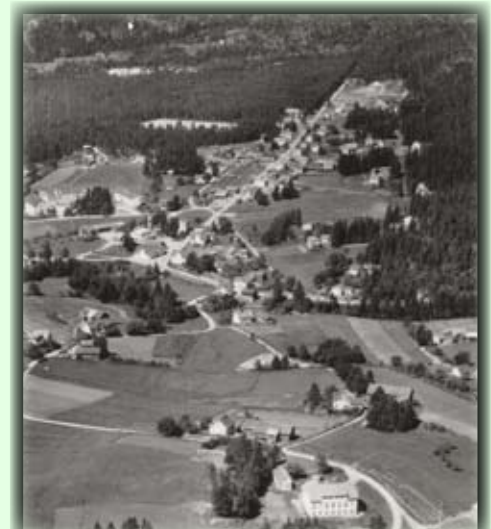
Slik så Birkeland sentrum ut i tidligere tider

Es ist eine gemerkte Route von Nordåsveien 52. Von hier geht die Route bis Spele fjell. Man kann auch zur Spitze kommen, auf dem Weg hinter Birkeland Drückerei (Zentrum Nord) und kommt dann auf die Route auf der Spitze der Hügel.