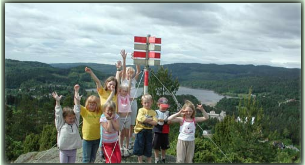
Barn på toppen under barnas kulturuke i 2004