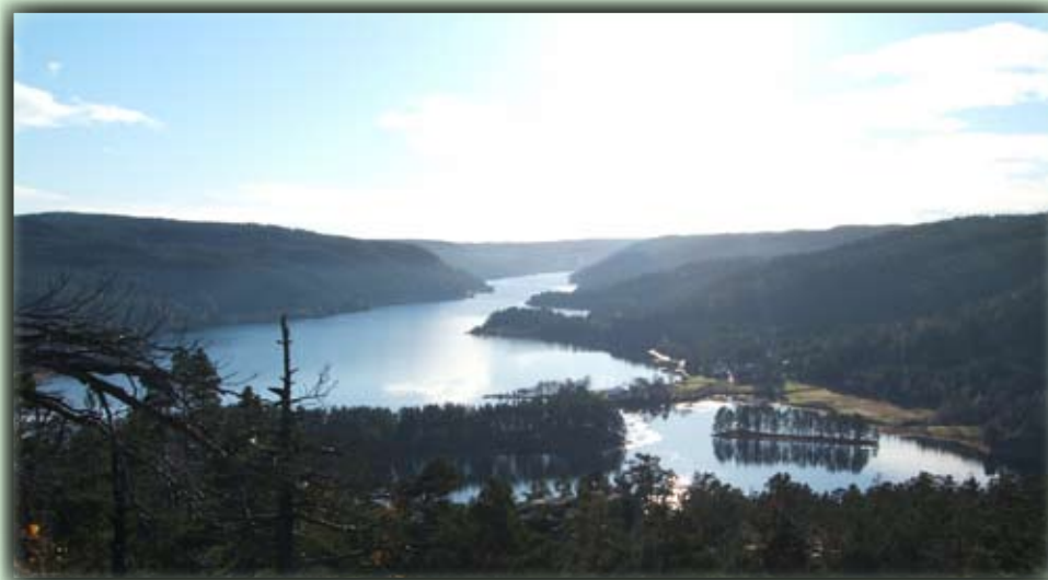
Fra toppen er det flott utsikt over Herefossfjorden