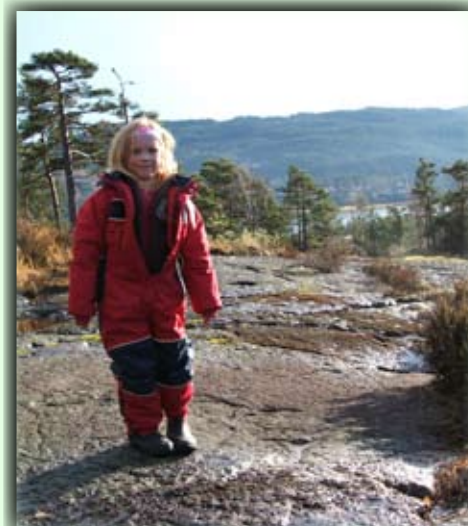
Det er fint å gå på fjellet opp mot toppen

Vorsicht! Der Zug kommt schnell!! Man muss das Tunneldach benutzen wenn man da kreuzt.