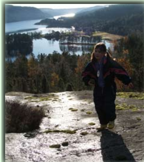
Skolebarna på Herefoss er ofte på tur til Kolåsen

Fra Herefoss sentrum (ved butikken) kjører man veien vestover mot Hanefossdammen og Nes ca 400 m. Herfra går det sti opp til høyre.