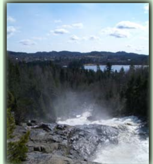
Flott utsikt fra toppen av fossen