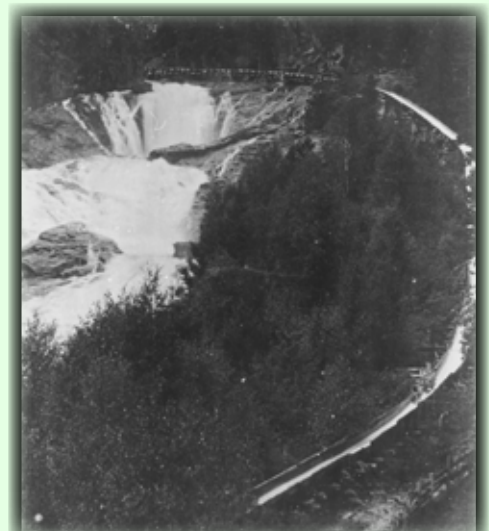
Slik så den gamle tømmerrenna ut som ble brukt i forbindelse med fløtinga